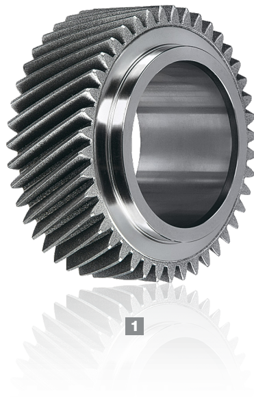
1 Rueda de diamante de revestimiento galvánico